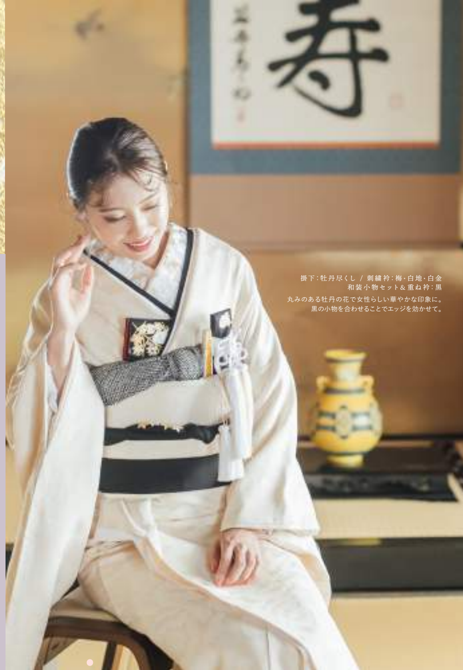
掛下:牡丹尽くし / 刺繍袴:梅・白地・白金 和装小物セット&重ね袴:黒 丸みのある牡丹の花で女性らしい華やかな印象に。 黒の小物を合わせることでエッジを効かせて。