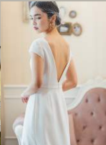
Lupinus しなやかなジョーゼットが纏う女性をより美しく魅せるストレートラインのドレス。トレンドの露出を控えたデザインはレトロモダンなスタイリングにピッタリ。

ウェディングの主演として、圧倒的な存在感を放つドラマティックなドレスたち。優美なカッティングやディテールはもちろん、バックスタイルにもこだわったエレガンスが魅力。花嫁の王道をいく、360°どこから見ても引き立つ美しさを堪能して。