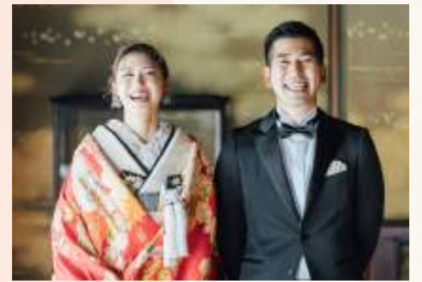
色打掛：慶長御所車文 TX:VO-002