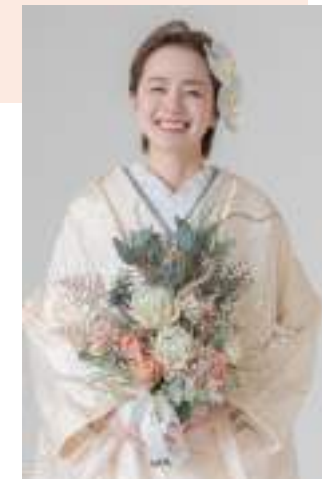
白無垢：1007 白無垢に彩を添え、華やかさをプラスしてくれるクラッチブーケ。肌なじみのいい色味にグリーンを入れて爽やかに。