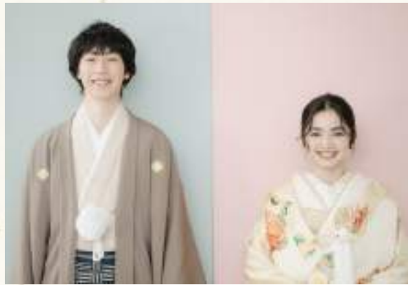
紋付：COTOベージュ紋服/色打掛：梅花の香り モカとベージュの色紋付とクリーム地の色打掛でトーンを合わせたナチュラルなコーディネート。