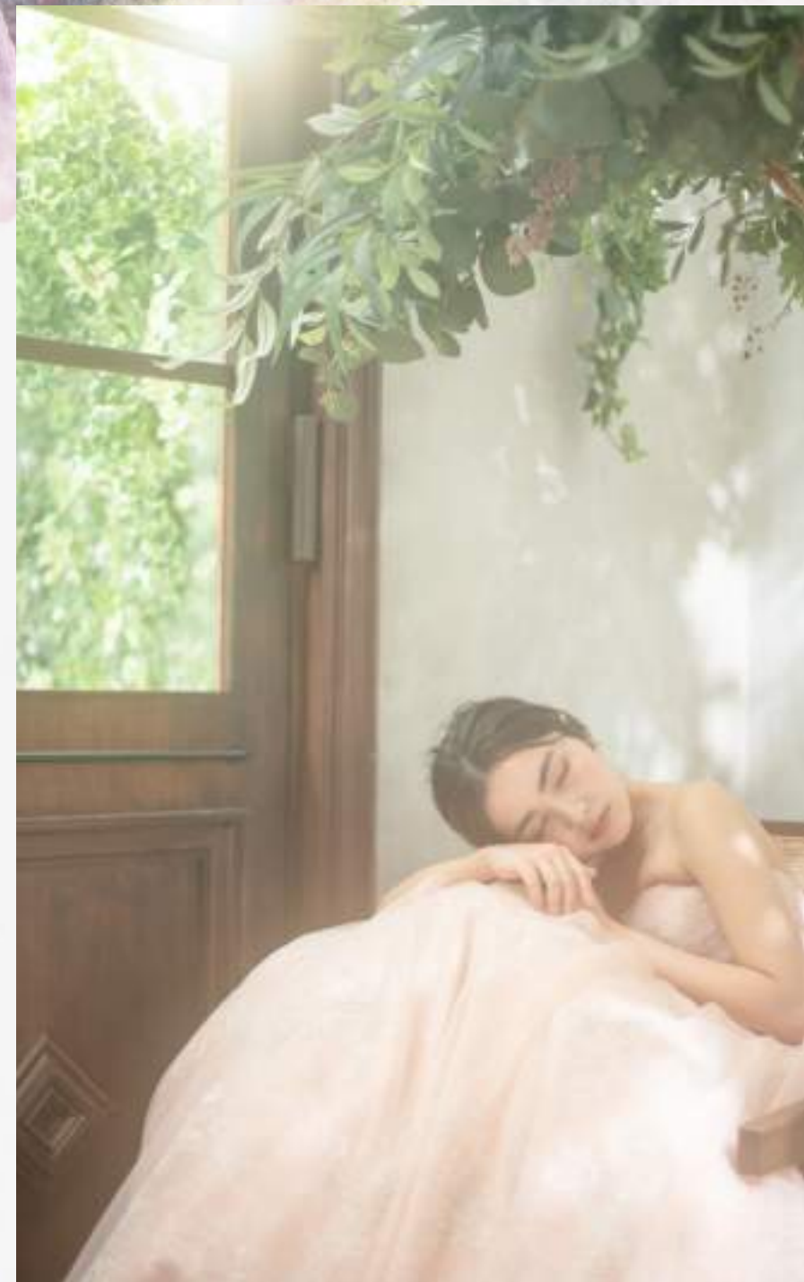
PEACH DREAM 肌なじみのいいアンティークなピンクのドレス。シルバーレースでウエストにポイントを。