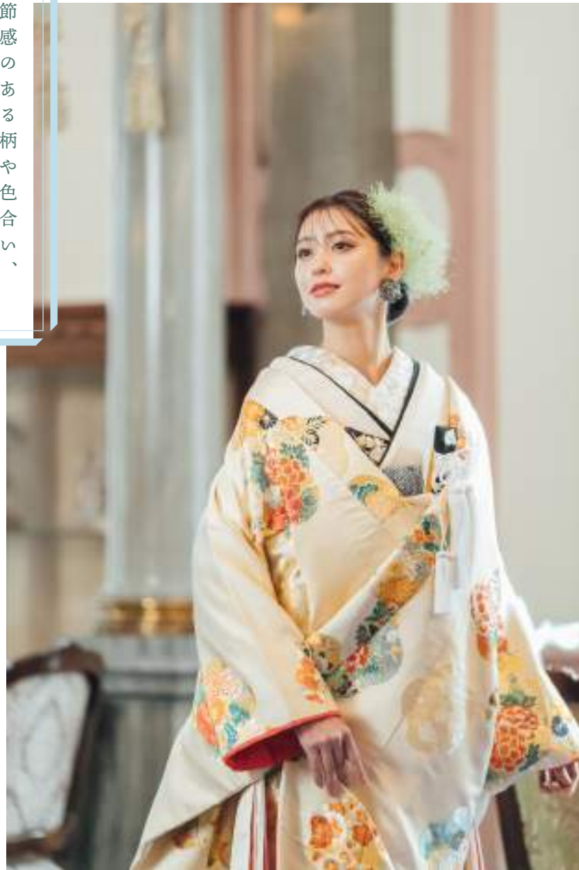
梅花の香り 梅は一年の百花に魁(さきがけ)で咲き、日本の代表花として多くの人々から愛される花。 全体にすっきりと描かれた梅の花を伝統的な西陣織の技術を用いて丁寧に織り上げた晴れの日に迎えられる花嫁にふさわしい逸品。