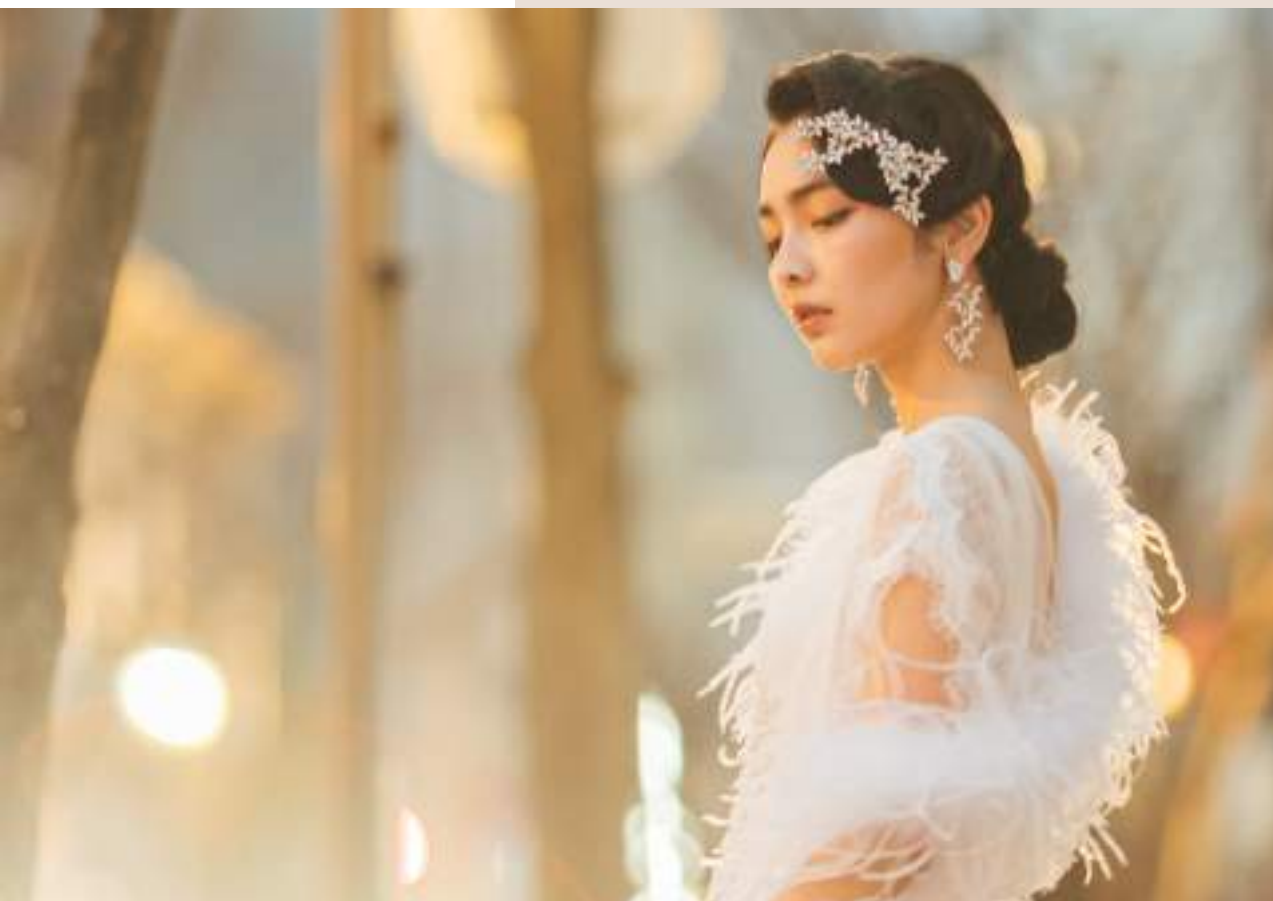
Peony 繊細な総ラッセルレースのソフトマーメイドラインのドレス。ウエストのシルバージュエリーの煌めきと肩から後ろへ柔らかに流れるソフトチュールトレーンが印象的なエフォートレスな1着。