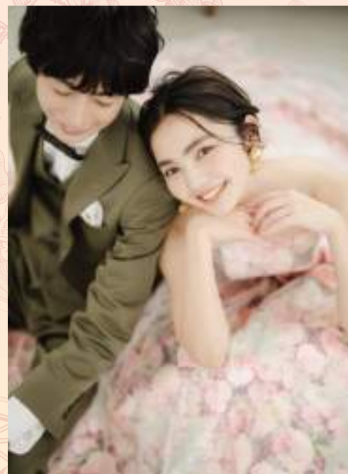
over les fleurs