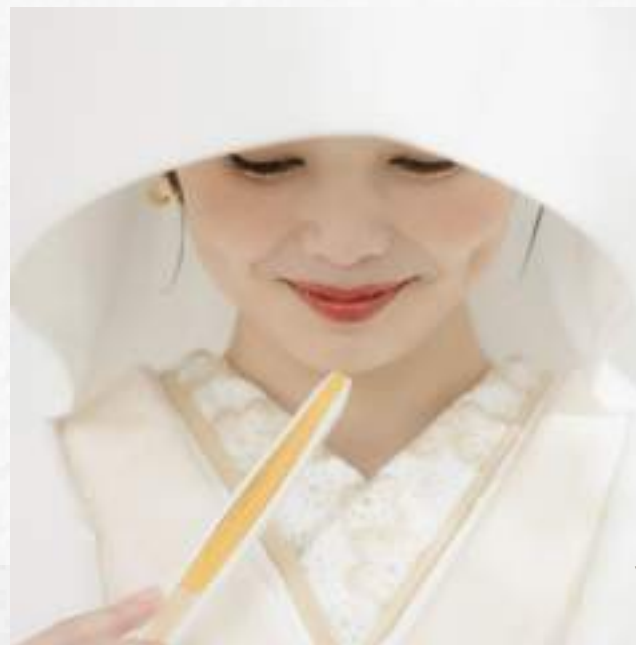
流水取翔鶴 鶴と流水文様が女性のおやかな美しさを表現。 鶴は「生命力の豊かさ」「長寿」を意味する神秘的で縁起の良い鳥。 鶴は一度夫婦になると一生添い遂げるといわれ夫婦円満の象徴。