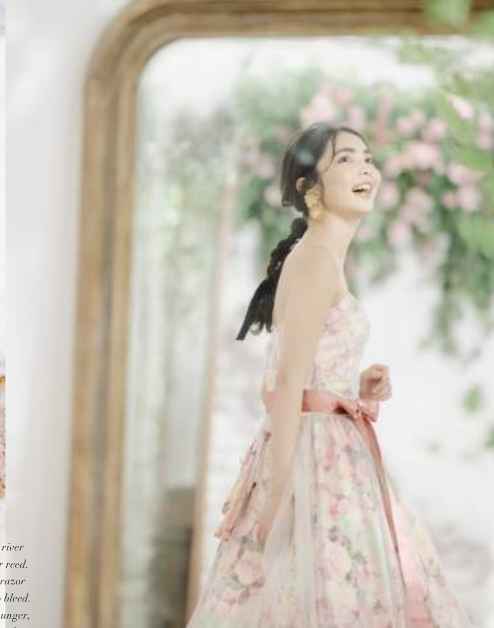
over les fleurs