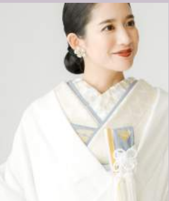
掛下:金七宝 / 刺繍袴:梅・白地・白金 和装小物セット&重ね袴:浅緑 「長寿」や「福」がいつでも続くという意味を持つ七宝柄を 金糸で施した掛下に、薄い緑色を合わせて爽やかな印象に。