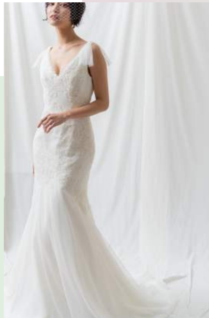
White by VERA WANG

Daisy トレンドのセパレートドレス。シンプルなデザインに贅沢な総レースを使用しスタイリッシュに。ディスティネーションウエディングやフォトウエディングにも好相性なマリエ。