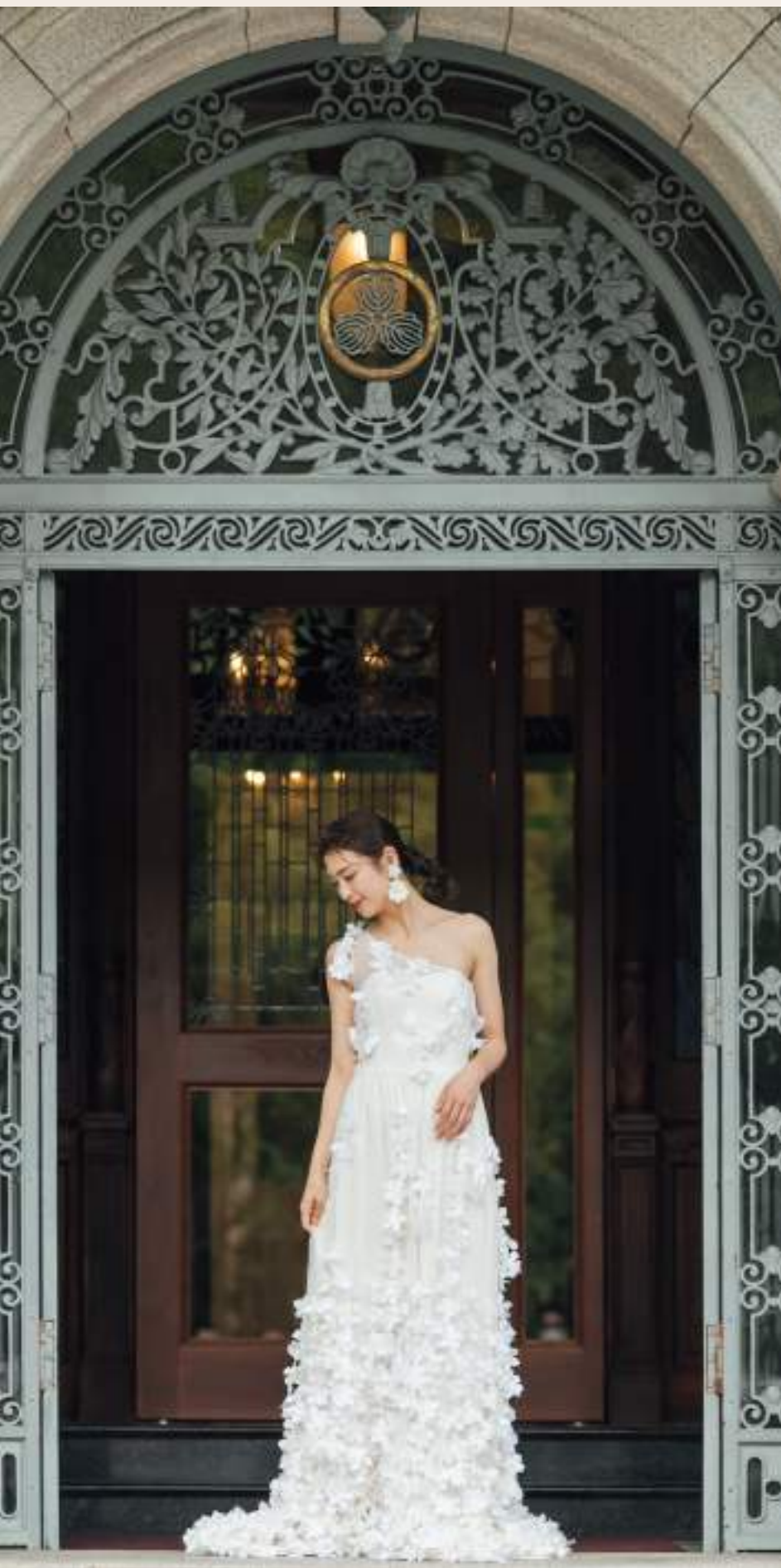
Skogstjerne イギリスの王室デザイナーが手掛けたアイボリーのスレンダーライン。チュールの上からフラワーモチーフをたくさんあしらった可憐なワンスルターデザイン。